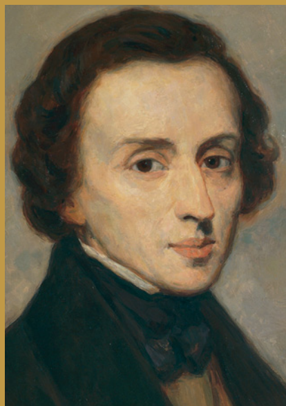
FRÉDÉRIC CHOPIN (1810-1849)