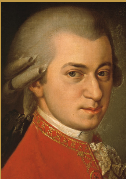
W. A. MOZART (1756-1791)